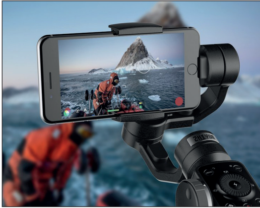
Met de Zhiyun smooth 4 gimbal kun je trillingsvrij filmen en de Filmic Pro-app bedienen

opnames. Een andere populaire gimbal met wat minder bedieningsmogelijkheden is de DJI Osmo Mobile 2 gimbal (circa € 137,-). Gebruik je deze gimbals op een smartphone met beeldstabilisatie, vergeet dan niet om via de instellingen van Filmic Pro je beeldstabilisatie uit te zetten.